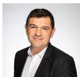
Benoist Apparu, In'li